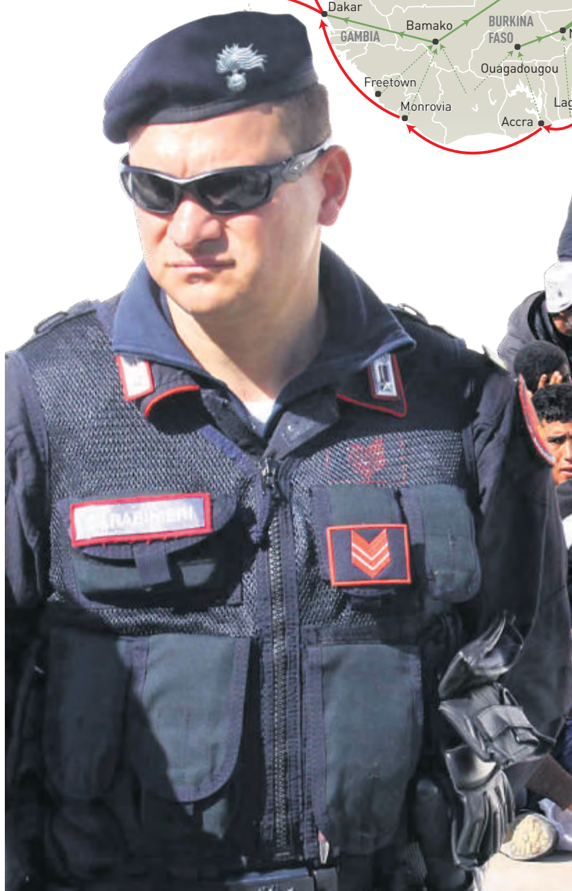
Immigranten aus Tunesien auf der Insel Lampedusa: Zu Spitzenzeiten strandeten hier mehrere Zehntausend Flüchtlinge jährlich