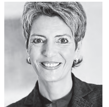
Keller-Sutter, Präsidentin der Konferenz der kantonalen Justiz- und Polizeidirektoren

Höchstwahrscheinlich die wenigsten von ihnen. Deshalb ist es den Kantonen so wichtig, dass Menschen ohne asylrelevante Gründe, sollten sie denn dereinst in die Schweiz kommen, gar nicht erst auf die Kantone verteilt werden.