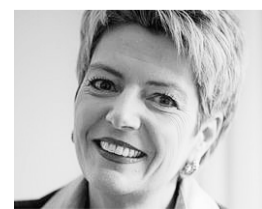
Karin Keller-Sutter St. Galler Regierungsrätin, Justiz- und Polizeidirektorin